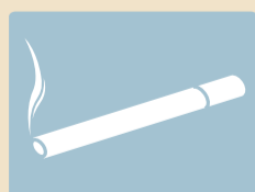
CIGARETTE BURN BRÛLURES DE CIGARETTE