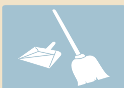
EASY MAINTENANCE ENTRETIEN FACILE