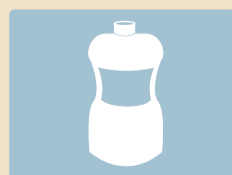
HOUSEHOLD CHEMICALS PRODUITS CHIMIQUES